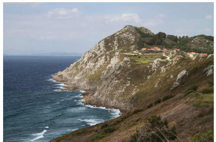
Vista do monte Facho desde o miradoiro da Caracola.