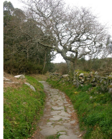
Vía de acceso ao castro