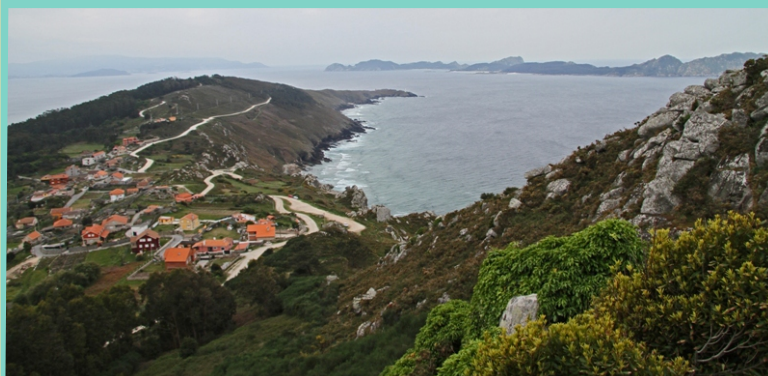
Vista desde o Facho cara ao sur, co Cabo Home, as Cíes á dereita e o Cabo Silleiro ao fondo.

Hai que achegarse a Donón desde Cangas ou Bueu, ou desde corredor do Morrazo. Deixamos o coche no aparcamento da Caracola (onde hai uns miradoiros sobre a costa), e collemos cara ao norte pola pista, ao pouco desvíamonos á esquerda por un camiño empedrado que sobe ao Facho (ao remate do empedrado hai que desviarse á esquerda e subir por un carreiro en costa sen sinalar para achegarse ao cume).