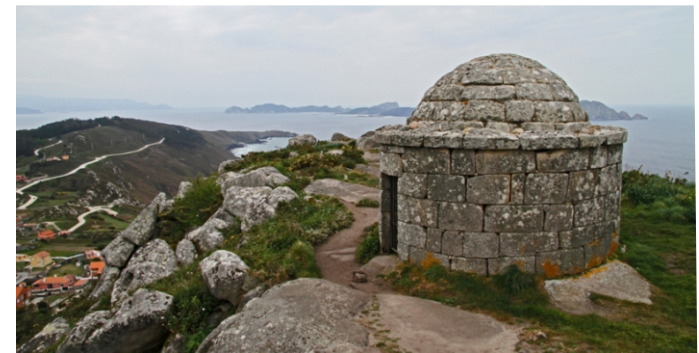
O Facho de Donón. O edificio actual é unha construción do século XVII que serviu de posto de vixía. Hai indicios de que no lugar houbo un antigo faro que se iluminaba con fogueiras.

Achegámonos á Costa da Vela, a costa ao mar aberto do Morrazo, entre as rías de Vigo e Pontevedra. Un entorno privilexiado desde o punto de vista paisaxístico e histórico. Altos cantís e amplas panorámicas sobre o Cabo Home, as illas Cíes e a boca da Ría de Vigo ata cabo Silleiro, cara ao sur, e cara ao norte Ons, o mar da Lanzada e, se o día axuda, a costa norte da ría de Arousa.