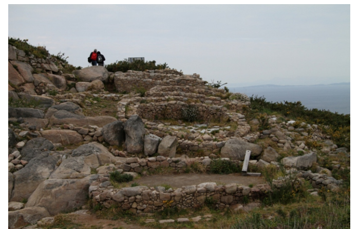
Construcións castrexas postas ao descuberto nas últimas excavacións.